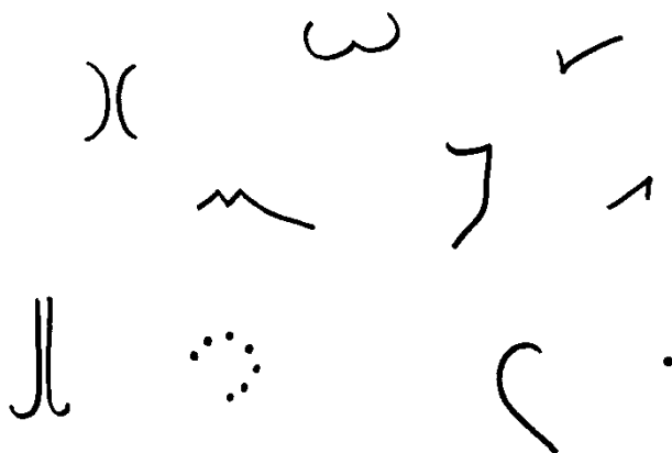
рис. 1 Стимульные фигуры